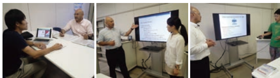
英語プレゼンの構成に関する相談に対応