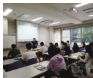
セミナー受講風景

Academic English Support Desk は、大阪大学に所属する全ての学生と教職員が国際的な場面で通用する高い英語発信能力を養うことを目的に、マルチリンガル・エキスパート養成プログラム（MLE）の一環として構築された教育プログラムです。平成 27 年 8 月の開始以来、専門性の高いネイティブのインストラクターによる 英語プレゼンテーションの個人指導(チュートリアル) の場を提供しており、国内でも類を見ない取り組みに好評を得ています。同プログラムではまた、ネイティブのインストラクターによる 英語プレゼンテーションに関するセミナー を全学および特定の部局を対象として定期的に開催しています。